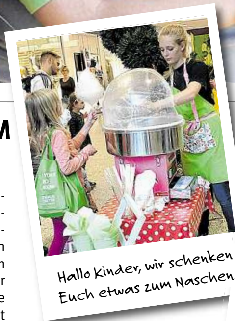
Hallo Kinder, wir schenken Euch etwas zum Naschen.