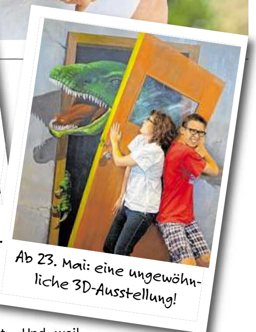
Ab 23. Mai: eine ungewöhnliche 3D-Ausstellung!

unter freiem Himmel, wer etwas für sein Freizeitvergnügen sucht, wird im Rathaus-Center nicht enttäuscht. Auch in modernen Restaurantbereichen und Cafés werden Sie an diesem Tag von 13 bis 18 Uhr kulinarisch aufs Beste verwöhnt. Das Rathaus-Center ist einfach ein bunter Marktplatz und Treffpunkt für Shopping und Vergnügen.